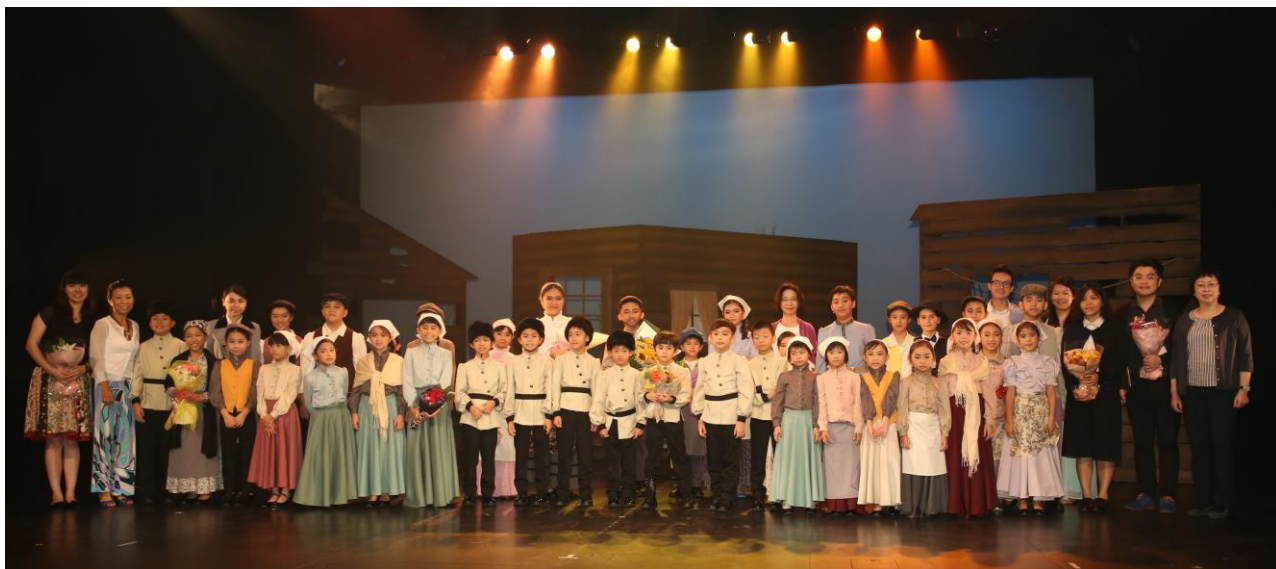
图 5 及 6：香港歌剧院夏令营的学员担纲演出百老汇经典音乐剧《屋顶上的提琴手》