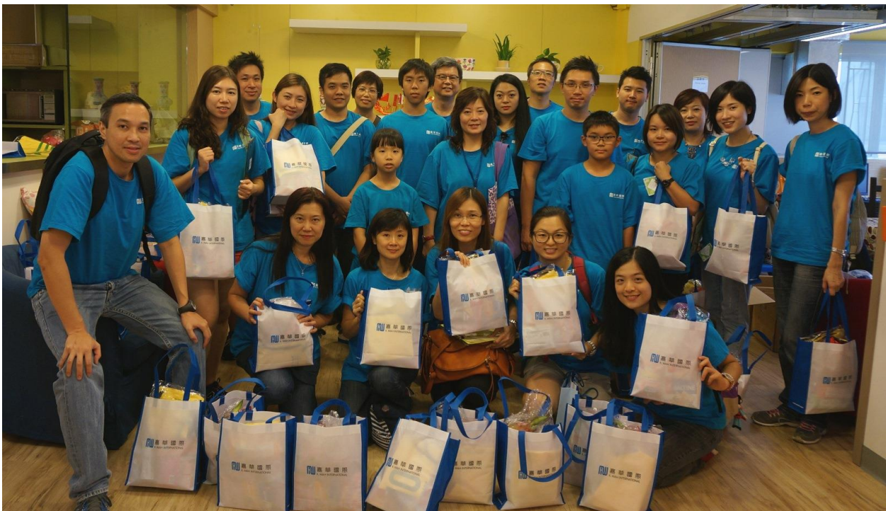
图 2 及 3：嘉华国际义工队为长者送上礼物包及节日祝福，传递爱心与关怀

图 1：嘉华国际员工及其亲友组成义工队伍，于圣雅各福群会辖下的浣纱长者中心亲自准备月饼及水果等节庆礼品，与长者提早庆祝中秋佳节